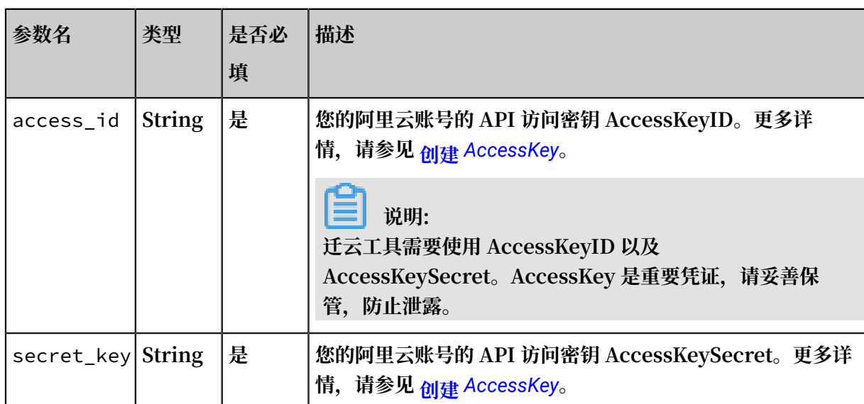
表 1-2: 服务器配置参数说明

如果您使用的是 Windows GUI 版本主程序，可以在 GUI 界面完成 user_config 配置。更多详情，请参见 迁云工具 Windows GUI 版本介绍 。