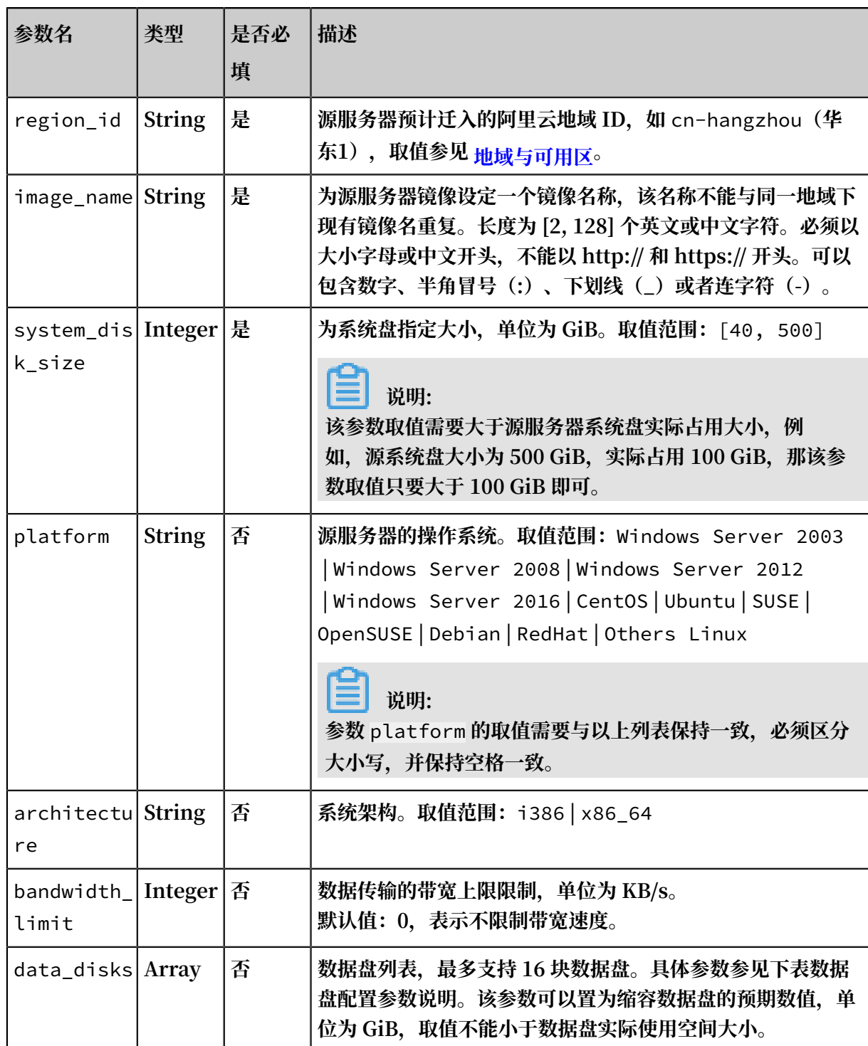
表 1-3: 数据盘配置参数说明