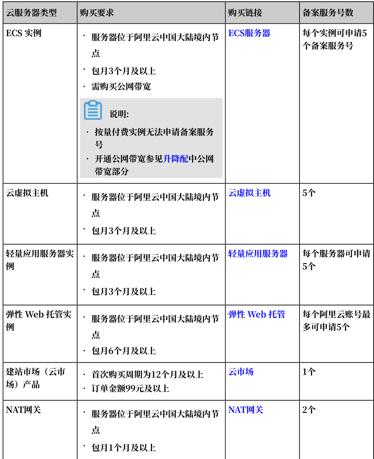
表 1-1: 支持备案的云服务器及备案网站数量

通过阿里云备案，需要先购买阿里云中国大陆节点服务器。目前阿里云可备案的服务器有：